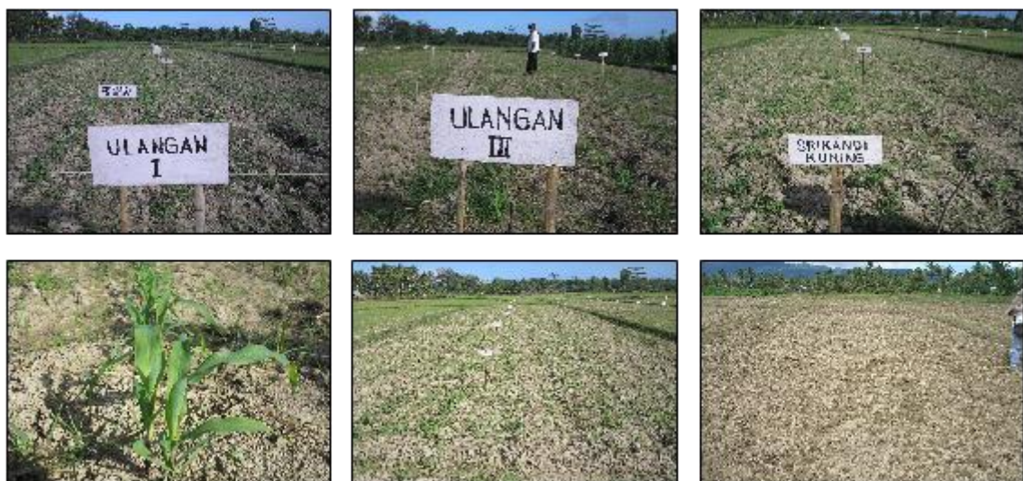
Gambar 1. Pertumbuhan tanaman jagung umur 12 hst pada kegiatan uji adaptasi Di Desa Waipirit, Kabupaten Seram Bagian Barat, MT II 2009.

Hasil pengukuran skala warna daun dengan menggunakan Bagan Warna Daun menunjukkan bahwa secara umum skala warna daun berkisar antara 4-5. Ini berarti bahwa ketersediaan hara N untuk mendukung pertumbuhan dan hasil tanaman jagung cukup.