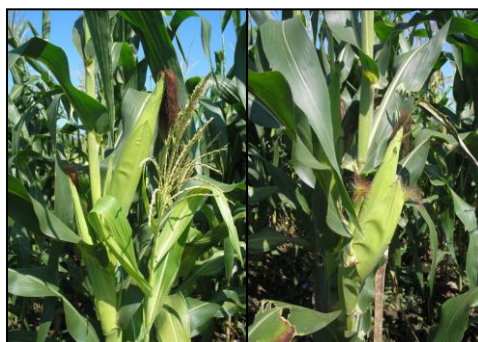
Gambar 2. Penampilan pertumbuhan dan perkembangan jagung pada kegiatan uji adaptasi Di Desa Waipirit, Kabupaten Seram Bagian Barat, MT II 2009.