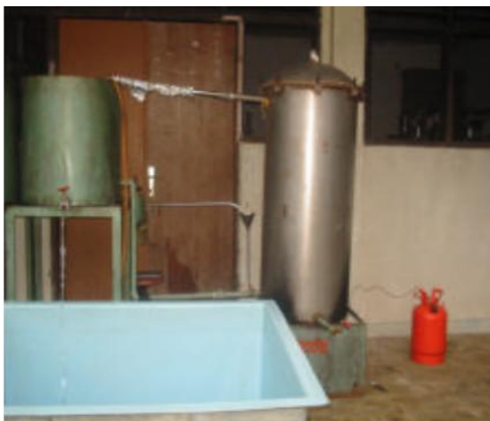
Gambar 1. Ketel Penyulingan

Ketel ini terbuat dari bahan stainless steel . Skema dari ketel beserta ukuran-ukuran dan kapasitasnya dapat dilihat pada gambar dan keterangan di bawah ini.