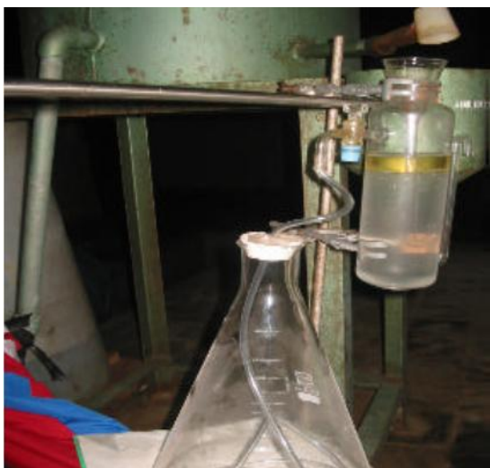
Gambar 4. Florentine Flask

Tabung ini berfungsi untuk menampung kondensat (air + minyak) dan sekaligus memisahkan campuran antara air dan minyak. Tabung pemisah minyak ini dapat memisahkan campuran antara minyak dan air secara otomatis dan kontinyu. Untuk mengisi air dalam tabung pemisah minyak, harus digunakan air jernih, tidak mengandung kotoran dan dianjurkan air destilasi. Tabung tersebut terbuat dari gelas yang sering disebut florentine flask bentuknya seperti pada gambar berikut ini.