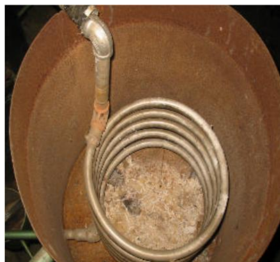
Gambar 3. Pipa Pendingin Spirial

Campuran uap (air + minyak) yang masuk ke pipa – pipa kondensor, akan didinginkan oleh air pendingin yang mengalir di antara pipa – pipa pendingin. Akibatnya uap diembunkan menjadi zat cair berupa campuran (air + minyak) yang keluar melalui pipa pada bagian ujung tabung pendingin.