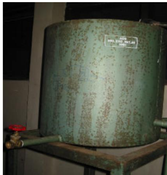
Gambar 2. Tabung Pendingin

yang mengalir yang dipakai sebagai pendingin sudah cukup bila air keluar dari pendingin suhu 80 °C dan destilat yang keluar dari pendingin mencapai suhu 25 °C - 30 °C. Seluruh bagian tabung ini terbuat dari stainless steel , dilengkapi dengan pipa pendingin spirial 250 cm.