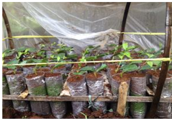
Gambar 1. Kondisi bibit tanaman teh di dalam sungkup pada saat 12 minggu setelah tanam