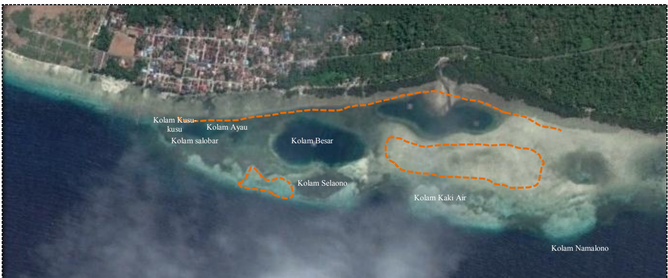
Gambar 2. Aktivitas bameti

Hal ini didukung dengan jawaban masyarakat bahwa telah terjadi perubahan ukuran hasil tangkapan sumberdaya dan jumlah jenis sumberdaya yang tertangkap. Ukuran hasil tangkapan sumberdaya dalam 5 – 10 tahun terakhir semakin menurun dan kecil. Sedangkan untuk atribut jumlah jenis sumberdaya yang tertangkap, masyarakat menjawab ada cukup banyak jenis lain yang juga turut tertangkap.