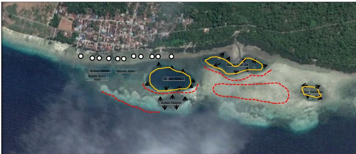
Gambar 3. Aktivitas penangkapan ikan