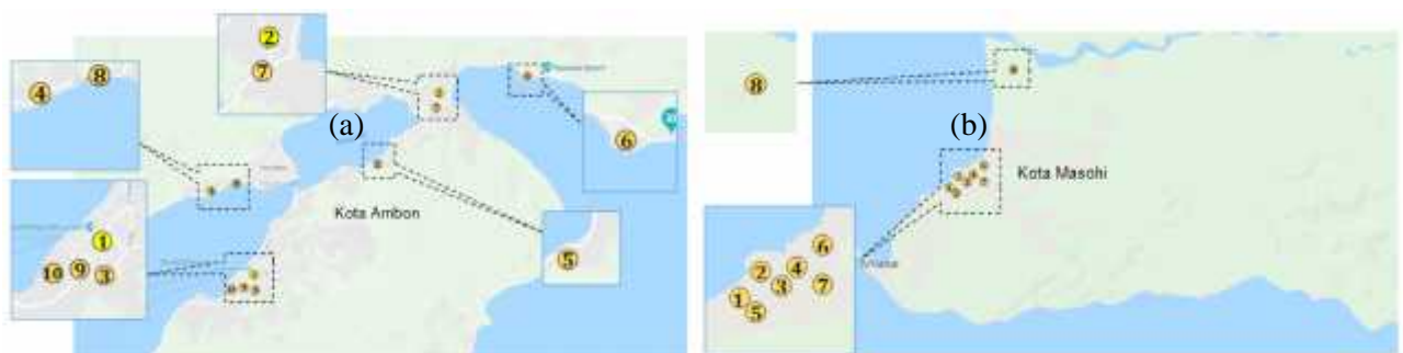
Gambar 2. (a) Ketersebaran lokasi supplier, mitra ekspedisi, dan pelanggan di Kota Ambon, (b) Ketersebaran pelanggan di Kota Masohi.

Untuk mendukung kegiatan distribusinya, maka koperasi memanfaatkan jasa transportasi feri. Saat ini, pelabuhan feri yang menghubungkan pulau Saparua dengan pulau-pulau lain hanya 1, yaitu pelabuhan Umeputih. Di pulau Ambon terdapat dua pelabuhan, yaitu Waai dan Hunimua, sedangkan di pulau Seram terdapat empat pelabuhan yang terdekat yaitu, Amahai, Ina-Marina, Wailey, dan Waipirit. Clustering ditentukan berdasarkan keberadaannya lokasi-lokasi pelanggan, mitra ekspedisi, supplier, dan pelabuhan-pelabuhan di setiap pulau. Dari keberadaannya, maka medan distribusi dibagi menjadi tiga cluster , yaitu Ambon, Seram, dan Saparua. Cluster Ambon terdiri dari 8 pelanggan, 1 supplier, 1 mitra ekspedisi, dan 2 pelabuhan yang berada di Pulau Ambon. Cluster Seram terdiri dari 8 pelanggan dan 4 pelabuhan yang berada di Pulau Seram. Sedangkan cluster Saparua diwakili oleh lokasi koperasi dan satu pelabuhan yang berada di pulau Saparua.