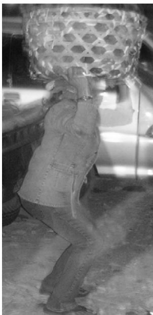
Posisi Buruh Saat Mulai Meluruskan Tubuhnya